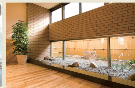
各所に椅子やテーブルを設置。食堂や談話室は自由にご利用可能です。居室以外にも居場所がたくさんあります。