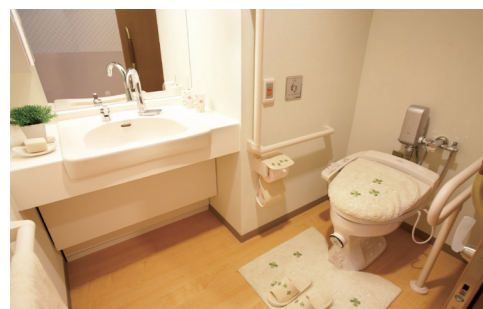
【洗面台】蛇口は自動水栓です。 【温水洗浄便座付トイレ】介助バー、コールボタンを設置。

開放感あふれるエントランス。毎日のおしゃべりや面会時の団らんに、自由におくつろぎいただけます。