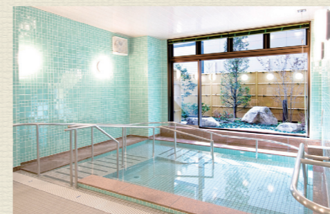
一般浴のほか、家庭のお風呂のような個別浴槽、寝たきりの方も入浴可能な特殊浴槽があり、お身体の状態に合わせた入浴が可能です。