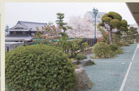
建物の裏手には庭があり、四季折々の花や木を楽しみながら散歩ができます。