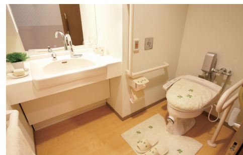
【洗面台】蛇口は自動水栓です。 【温水洗浄便座付トイレ】介助バー、コールボタンを設置。