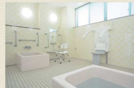
家庭のお風呂のような個別浴槽、寝たきりの方も入浴可能な特殊浴槽があり、お身体の状態に合わせた入浴が可能です。