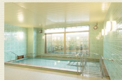
一般浴のほか、家庭のお風呂のような個浴、寝たきりの方も入浴可能な特殊浴槽があり、お身体の状態に合わせた入浴が可能です。