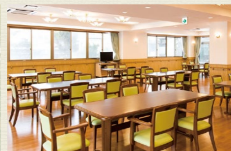
各所に椅子やテーブルを設置。食堂や談話室は自由にご利用可能です。居室以外にも居場所がたくさんあります。