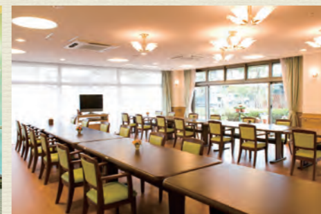
各所に椅子やテーブルを設置。食堂や談話室は自由にご利用可能です。居室以外にも居場所がたくさんあります。