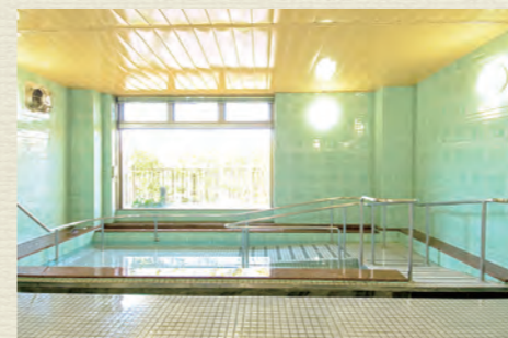
一般浴のほか、家庭のお風呂のような個浴、寝たきりの方も入浴可能な特殊浴槽があり、お身体の状態に合わせた入浴が可能です。