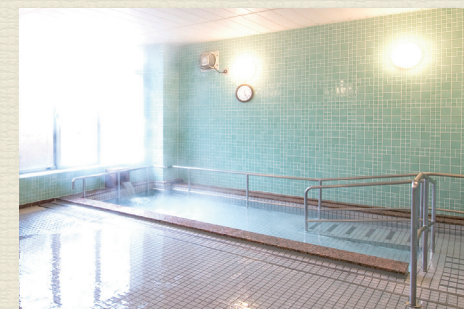
一般浴のほか、家庭のお風呂のような個浴、寝たきりの方も入浴可能な特殊浴槽があり、お身体の状態に合わせた入浴が可能です。