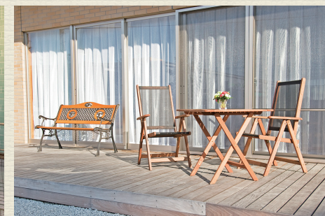
各所に椅子やテーブルを設置。食堂や談話室は自由にご利用可能です。