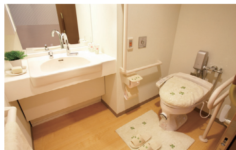
【洗面台】蛇口は自動水栓です。 【温水洗浄便座付トイレ】介助バー、コールボタンも完備