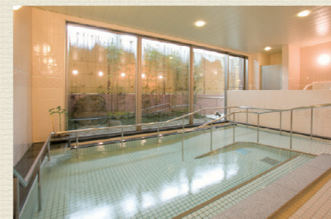
一般浴のほか、家庭のお風呂のような個浴、寝たきりの方も入浴可能な特殊浴槽があり、お身体の状態に合わせた入浴が可能です。