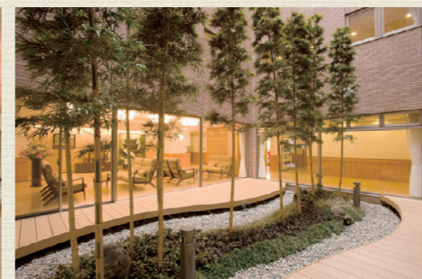
各所に椅子やテーブルを設置。食堂や談話室は自由にご利用可能です。居室以外にも居場所がたくさんあります。