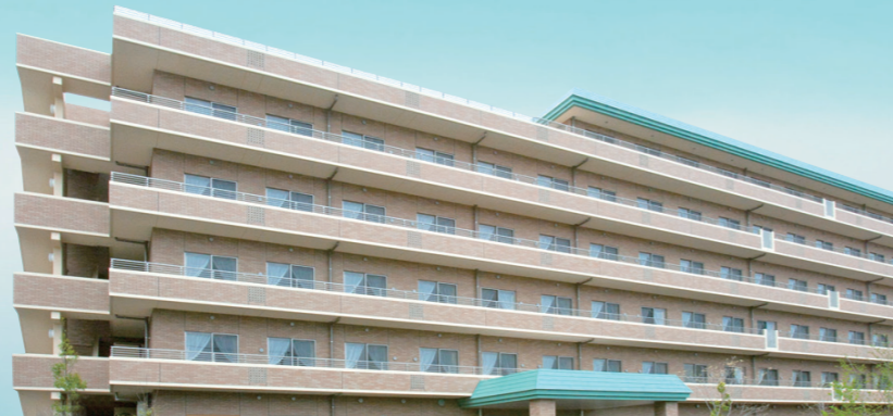
土地・建物の権利形態/建物賃借(2011年4月より31年契約)