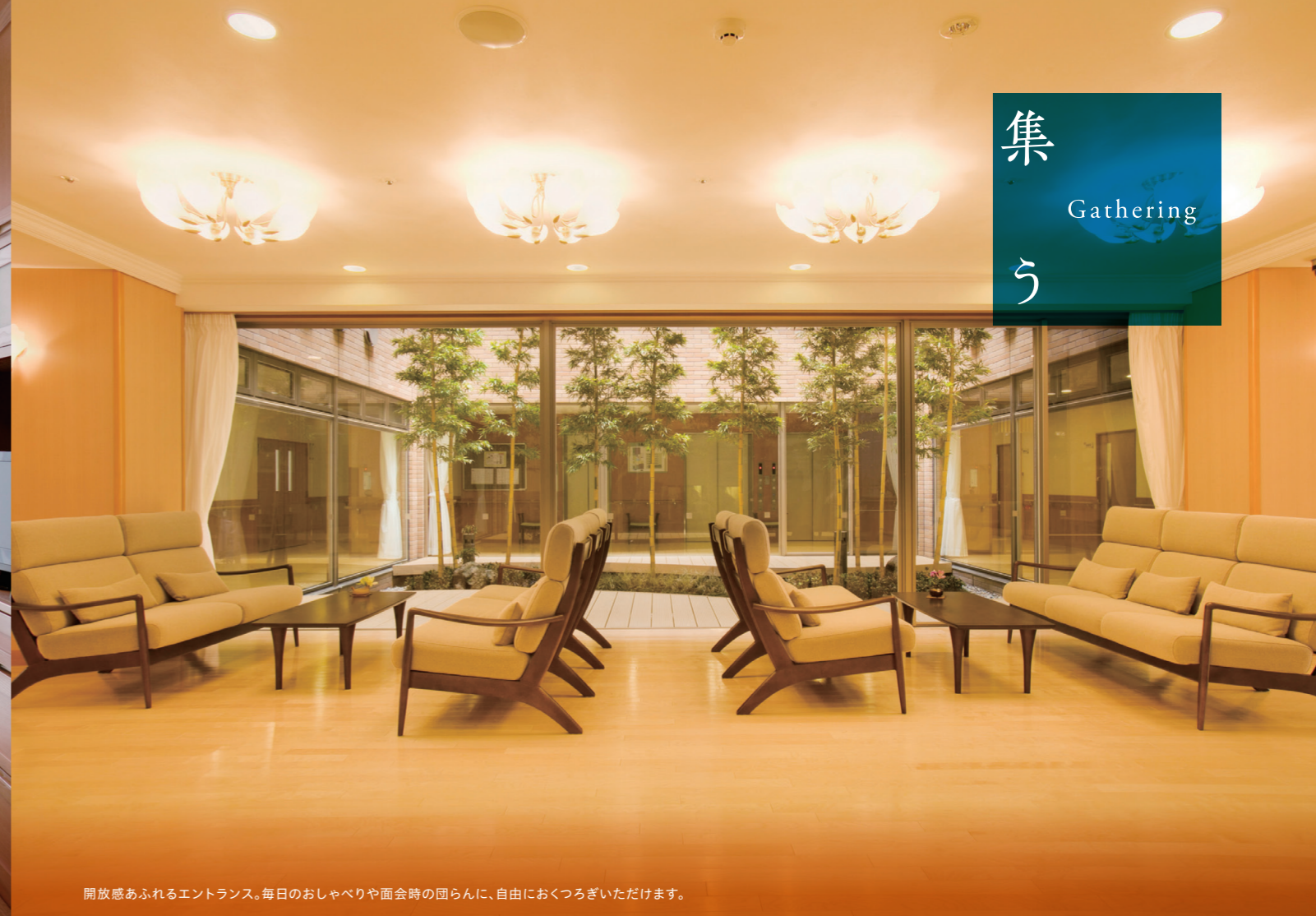
開放感あふれるエントランス。毎日のおしゃべりや面会時の団らんに、自由におくつろぎいただけます。