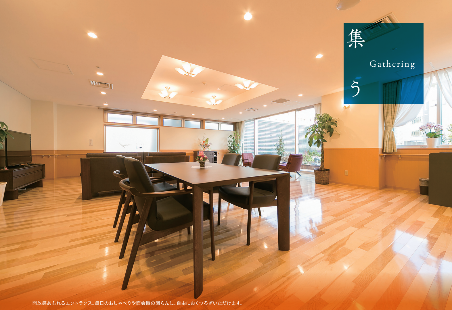
開放感あふれるエントランス。毎日のおしゃべりや面会時の団らんに、自由におくつろぎいただけます。