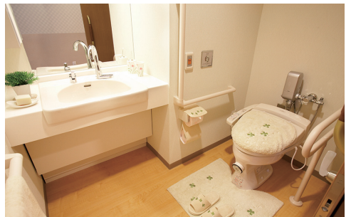
【洗面台】蛇口は自動水栓です。 【温水洗浄便座付トイレ】介助バー、コールボタンも完備