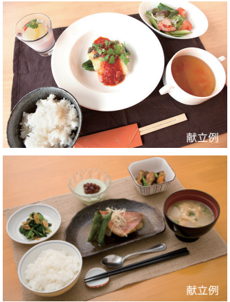
健康と美味しさにこだわった手作りの食事