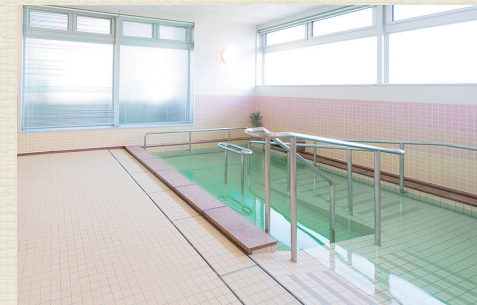
一般浴のほか、家庭のお風呂のような個浴、寝たきりの方も入浴可能な特殊浴槽があり、お身体の状態に合わせた入浴が可能です。