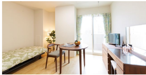
1名様居室イメージ

高齢者住まい法に基づいて建てられた高齢者向けの賃貸住宅で、バリアフリー構造により高齢者に配慮した設計です。24時間の見守り(安否確認)や生活相談といった、さまざまな介護サービスや生活支援などの各種サービスを選択して受けることができます。