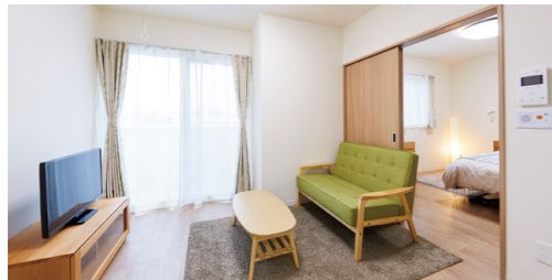
2名様居室イメージ