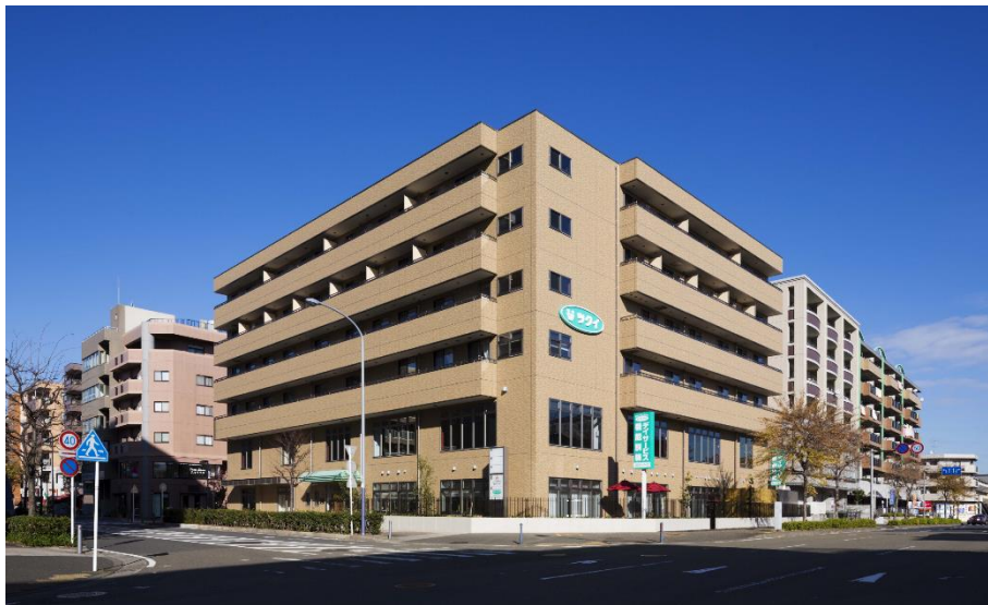
「ツクイ・サンフォレスト横浜センター北」外観

*横浜市民意識調査の周辺環境で都筑区は「暮らしやすい」の総合評価が9割を超え、横浜市18区中第1位を獲得。さらに12項目の個別評価で3項目が第1位、住環境と都市機能性がバランスされた暮らしやすい街として高く評価されました。