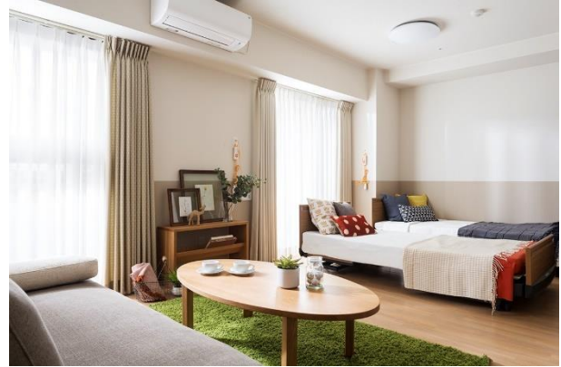
2 名様用居室イメージ