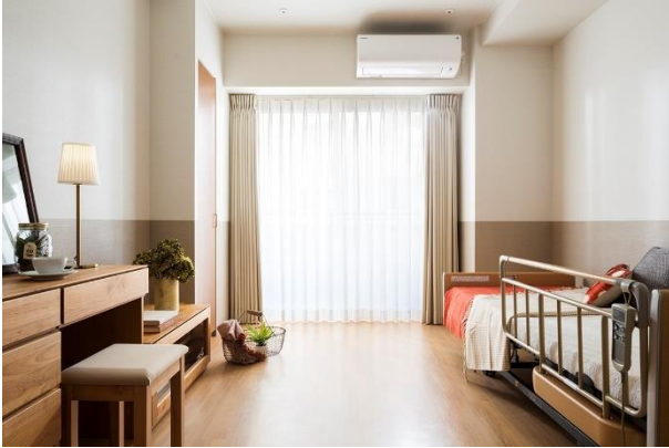
1 名様用居室イメージ

併せて、多彩な共用施設を配して、お客様が豊かな時間を過ごせる住空間を提供します。